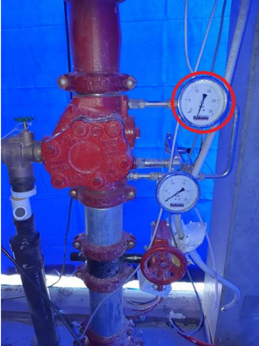
Bilde 1 Kontrollventilsett med manometer

Rørlegger oppfatter at manometer fremstår som ødelagt. Som et ledd i arbeidet med å skifte manometeret bestemmer rørlegger seg for tømme sprinkleranlegget. Rørlegger står i teknisk rom og observerer tømningen. Så plutselig eksploderer rommet med en blåaktig farge.