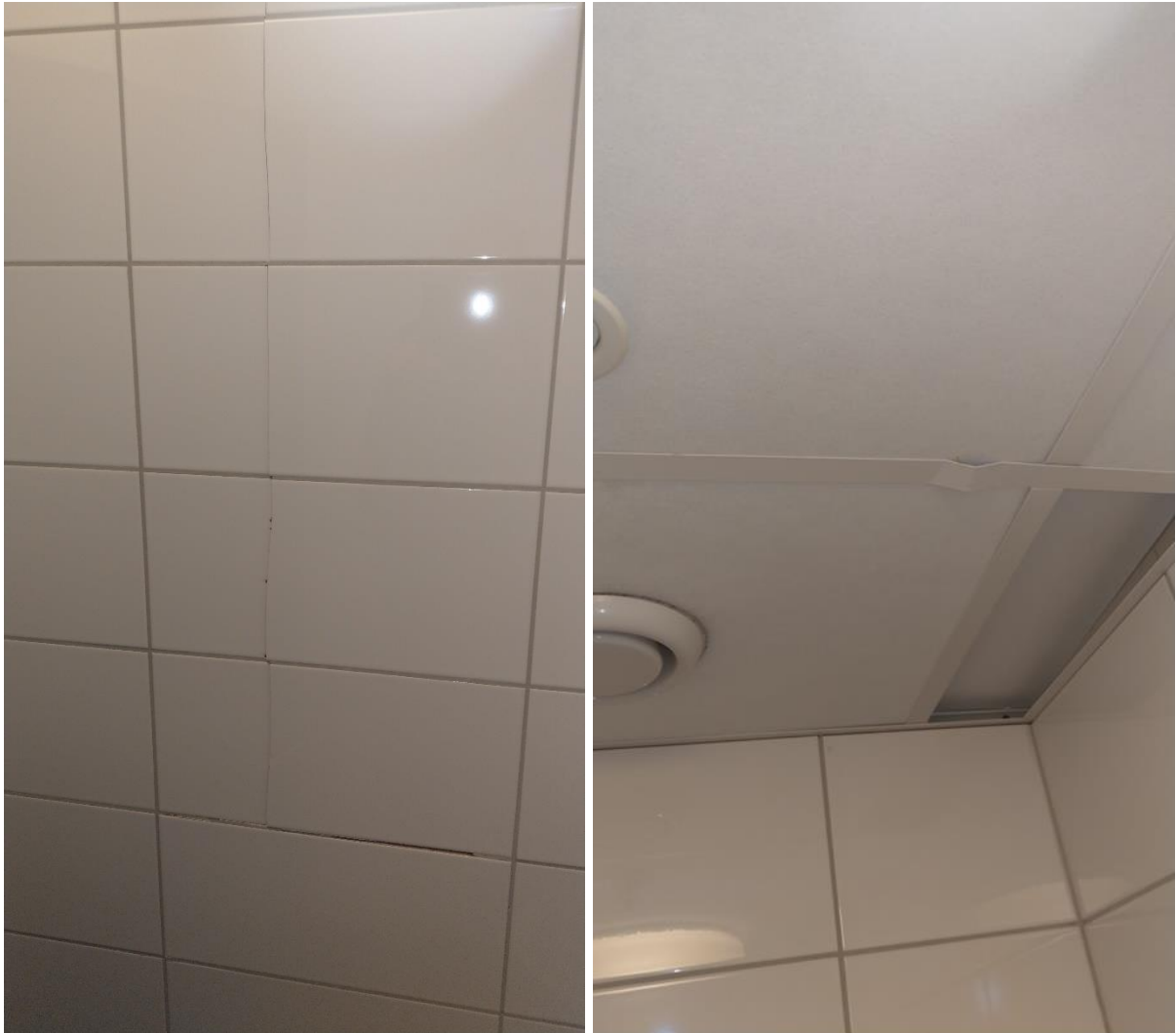
Bilde 3 og 4 Skader fliser bad og himling

Selv langt inne i bygget var det betydelig skader og merker etter eksplosjonen, som illustrerer kraften i eksplosjonen.