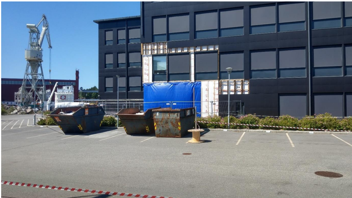
Bilde 2 Bilde fasade

Som bilder i media og under viser, fikk bygget store skader. Ytterveggene rundt teknisk rom der sprinklersentralen stod, ble bokstavelig blåst vekk.