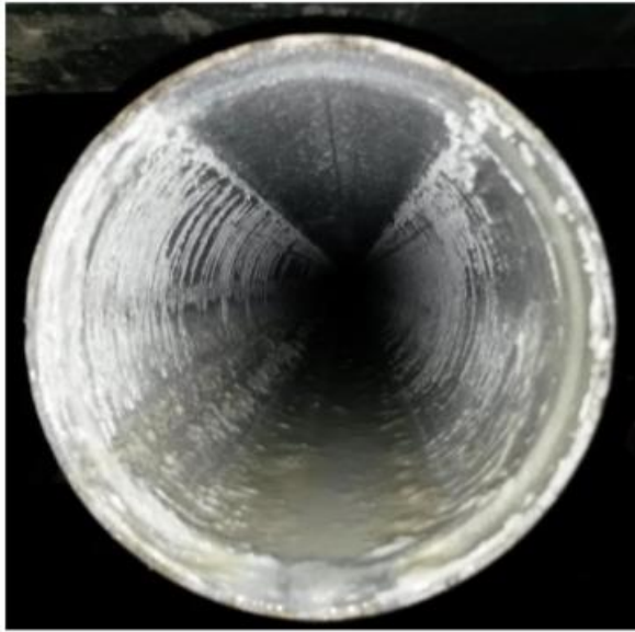
Bilde 4 Forsinket galvanisertrør etter nedtapping på annet anlegg

Levetiden som rørene var godkjent med, var basert på at de var helt vannfylte. Det betyr da at korrosjonsprosessen styres da hovedsakelig av om anlegget er korrekt bygget med lufteventiler, slik at all luft i rør ikke blir komprimert, men luftes ut ved oppfylling.